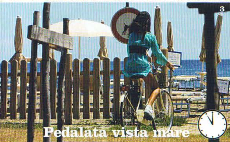
3 Pedalata vista mare