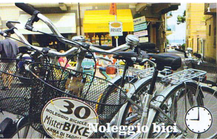
1 Noleggio bici