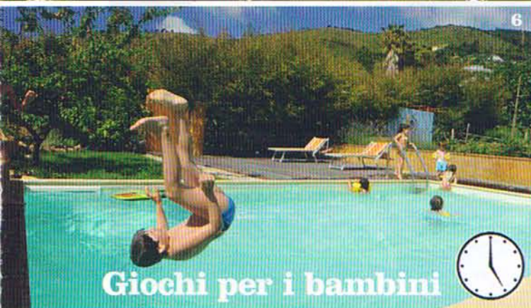
7 Giochi per i bambini

1. Ore 9: noleggio bici. A Sanremo, Arma di Taggia o San Lorenzo al Mare. 2. Ore 10: colazione robusta nel ristorante Il Vascello (o cena: specialità carne alla brace), a Santo Stefano al Mare. 3. Ore 11: passeggiata in bicicletta e piccole deviazioni fronte spiaggia . 4. Ore 15: si affidano le bici al furgoncino che le porta in campagna, per il pranzo o la notte in agriturismo. 5. Ore 16: riposo nell' azienda agricola Uliveto Saglietto , a Poggi d'Imperia. Appartamenti da 680 € a settimana. 6. Ore 17: per i bambini, sosta nel parco con piscina dell' Agriturismo Zemin , a Taggia. 7. Ore 20: cena alla Fontana dell'Olmo , a Drego, dove si dorme in malghe ristrutturate.