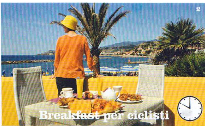
2 Breakfast per ciclisti